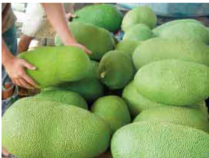
Figura 1. Frutos de yaca ( Artocarpus heterophyllus Lam.)

La superficie establecida de yaca en México ha crecido significativamente de 16.5 ha en 2002 a 797 ha en 2011, con un rendimiento aproximado de 15.5 ton ha -1 y valor de la producción de 4.5 millones de dólares. En este contexto, Nayarit es el principal productor al concentrar 80% de la superficie nacional (SIACON-SAGARPA, 2012). De los árboles de esta especie se aprovecha prácticamente todo; del tronco y las ramas, se obtiene madera; las hojas se usan como forraje de ganado y para cocinar; las semillas secas se