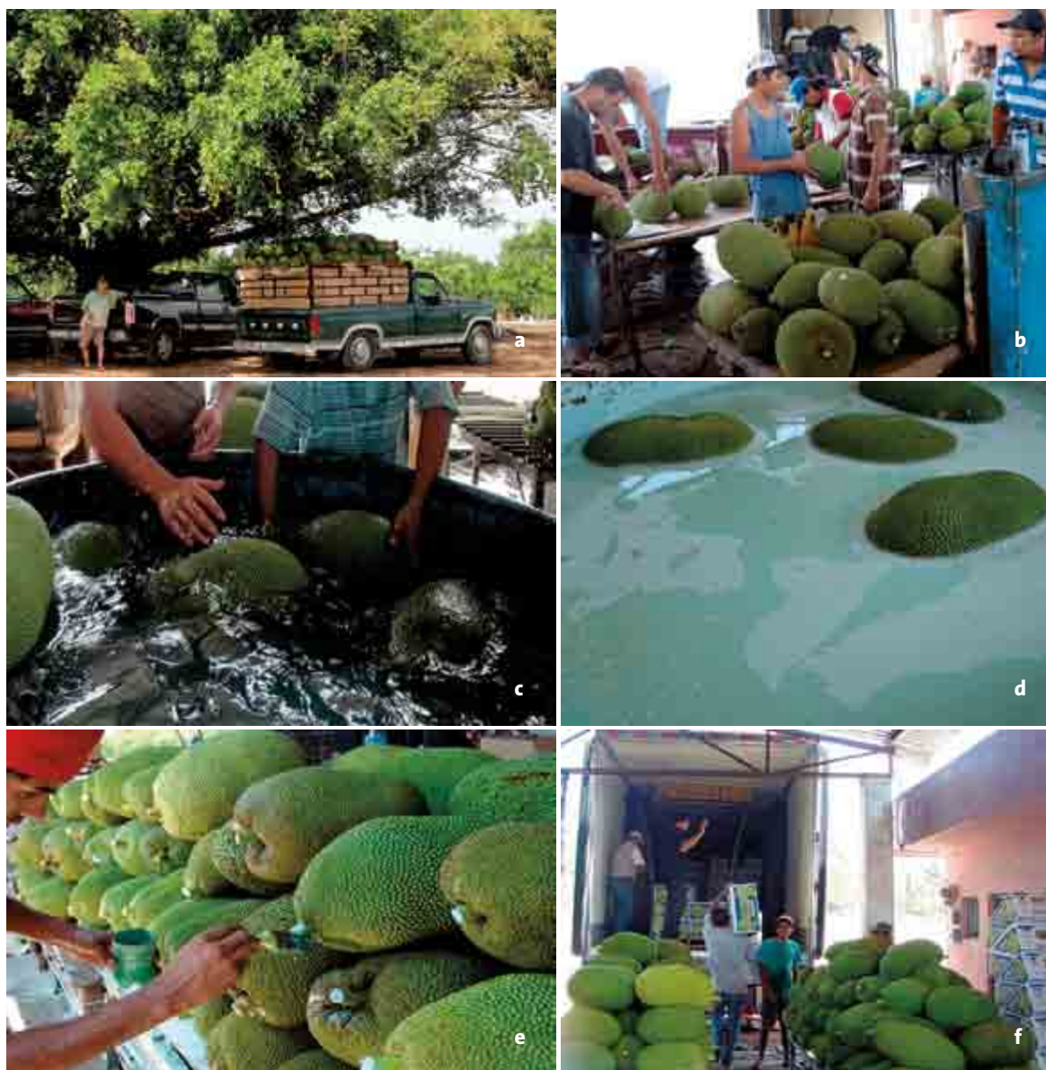
Figura 6. Manejo postcosecha de la yaca ( Artocarpus heterophyllus Lam.) de exportación en Nayarit. a: Llegada del fruto a la empacadora; b: Selección, limpieza y pesado de frutos; c: Lavado de frutos; d: Inmersión en fungicida; e: Sellado de pedúnculo; f: Empaque y carga del contenedor.

Pushkumara D.K.N.G. 2006. Floral and fruit morphology and phenology of Artocarpus heterophyllus Lam. (Moraceae). Sri Lanka Journal Agriculture Science 43:82-106.