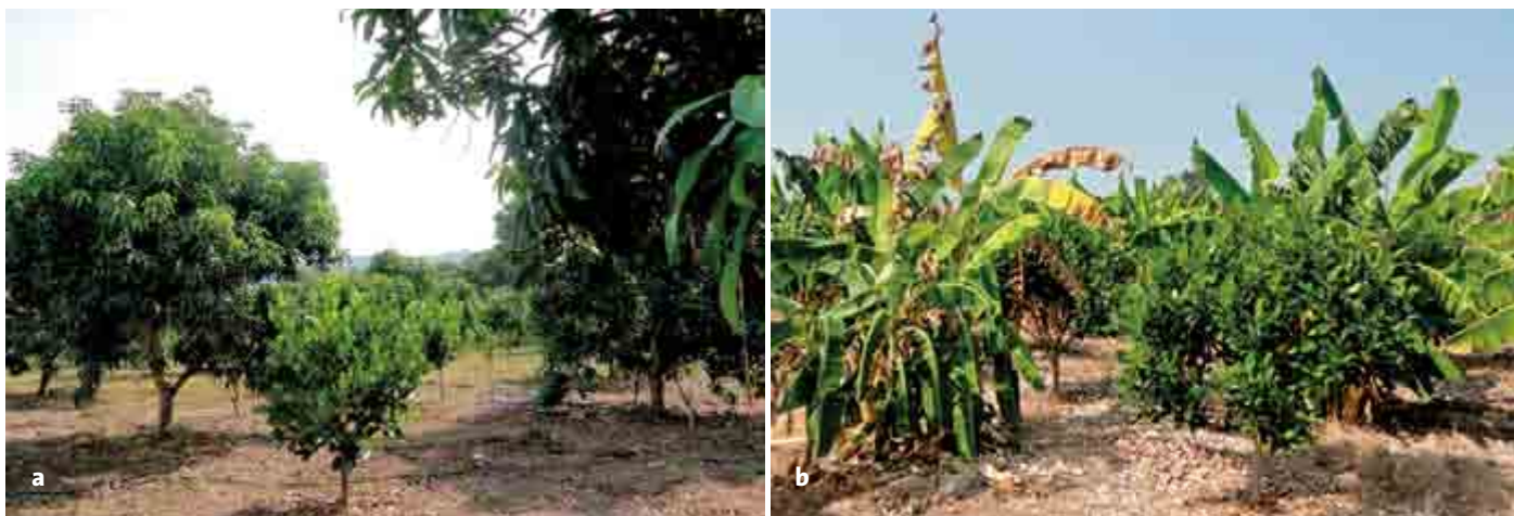
Figura 4. Inserción de árboles de yaca ( Artocarpus heterophyllus Lam.) en huertas comerciales de mango ( Mangifera indica ) (a) y plátano ( Musa paradisiaca ) (b).

El fruto seleccionado se limpia con aire comprimido, a fin de eliminar polvo, ácaros, insectos u otros materiales físicos (Figura 6b). Posteriormente, los frutos se pesan y