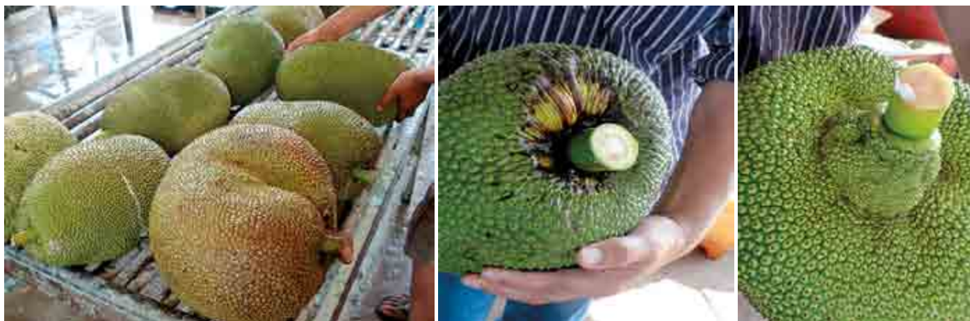
Figura 5. Frutos de yaca ( Artocarpus heterophyllus Lam.) que no reúnen los requisitos de calidad para la exportación, debido a sobremaduración, malformaciones del fruto, pedúnculo y pudriciones.

se lavan en una solución con hipoclorito de calcio; se dejan escurrir y nuevamente se realiza otra inmersión pero ahora en solución fungicida, cuidando el pH del agua para obtener una mayor estabilidad de la solución (Figura 6c; 6d). Finalmente, los frutos se secan y se procede a sellar el pedúnculo con oxiclورو de cobre (Figura 6e) para evitar desarrollo de hongos, obstruir la salida de látex y evitar daños por corrosión al fruto durante el almacenamiento y transporte. Dependiendo del tamaño del fruto se colocan 1, 2 y hasta 3 frutos en cajas de 40x50x25 cm, que tienen aberturas para la circulación del aire en el contenedor. La temperatura durante el transporte es de 12-14 °C, toda vez que es un fruto sensible a daños por frío (Figura 6f).