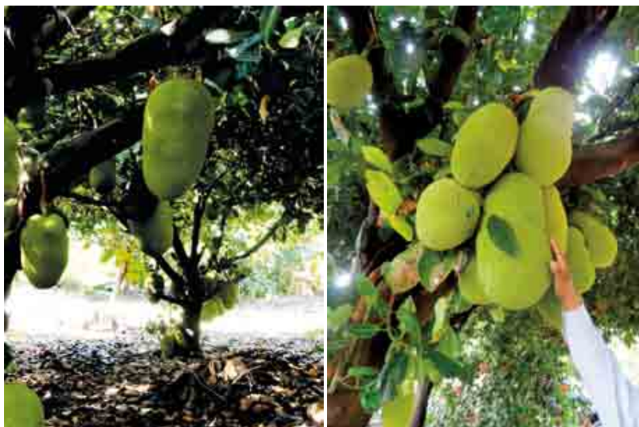
Figura 2. Árboles de yaca ( Artocarpus heterophyllus Lam.) en producción.

de panal; cada polígono representa una flor. En el fruto pueden distinguirse tres regiones primarias: a) eje o centro del fruto, con presencia de células laticíferas (no comestible); b) perianto, mayor porcentaje comestible del fruto y región media fusionada (formando el anillo del sincarpo) y la región externa córnea no comestible de color verde y amarillo al madurar; y c) fruto verdadero (semillas) que se desarrolla desde el carpelo del ovario