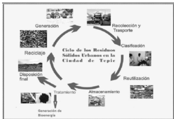
Figura 2. Ciclo de vida de los RSU.