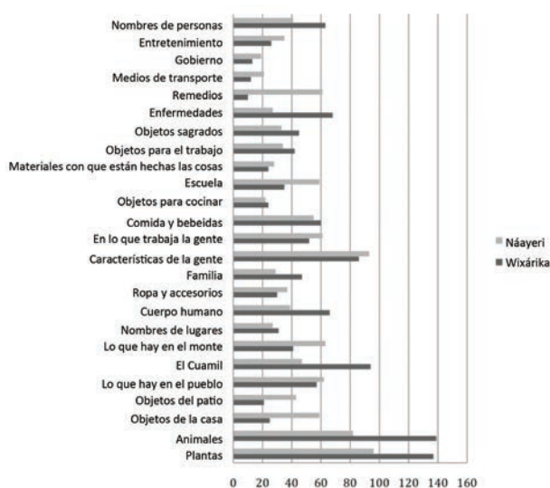
Gráfica 1. Total de palabras diferentes obtenidas por centro de interés en wixárika y en náayeri

gente', 'lo que hay en el pueblo', etc. Hay algunos centros de interés que pueden considerarse más cerrados, en el sentido de que solo un número específico de palabras lo componen, como sería el caso de 'gobierno', 'medios de transporte', 'familia', 'el cuerpo humano', etc. Pero, ¿en realidad las palabras que conforman estos centros de interés coinciden con las palabras que uno esperaría encontrar en un corpus similar de español o de inglés?