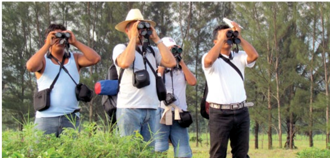
Monitores comunitarios observando aves en Los Tuxtlas.

Personalmente creo que es importante que la gente aprenda a observar aves para que las conozca, las proteja y las disfrute, ya que la observación de aves es una actividad muy bonita y relajante. Observando a las aves podemos propiciar un cambio positivo de actitud en la gente, desde los niños hasta los adultos, para que aprendan a valorar estos animales y su entorno.