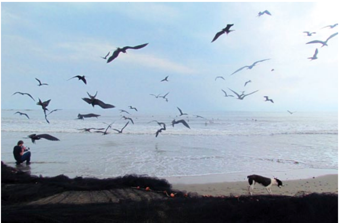
Amanecer en la playa de la comunidad de pescadores Arroyo de Liza, Veracruz.