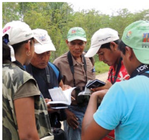
Revisión de aves identificadas durante una práctica de muestreo.