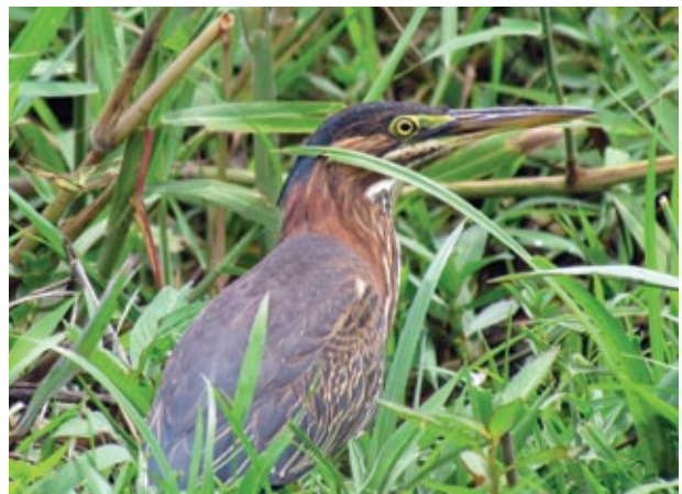
Garceta verde ( Butorides virescens ) de la comunidad Los Arrecifes, Veracruz.