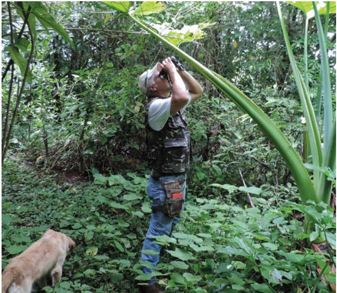
Recorridos de observación de aves en Los Tuxtlas, Veracruz.