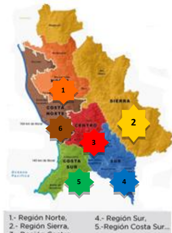
Regiones en que se divide el estado.