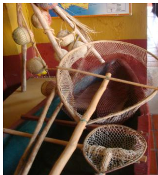
Figura N° 9 “Tapeiste,” recolector de camarones. Al fondo Barcinas de Camarón. Museo del Sitio, Isla de Mexcaltitán.