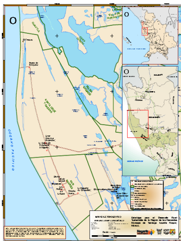
Figura N° 3 Los ejidos de Santa Cruz y del ejido de San Andrés, comarca de las Haciendas, municipio de Santiago Ixcuintla.