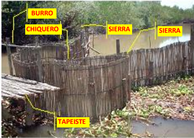
Figura N° 5 Partes de que consta un Tapo.