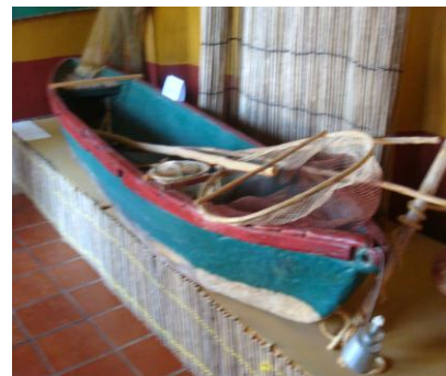
Figura N° 10 Canoa y artes de pesca.