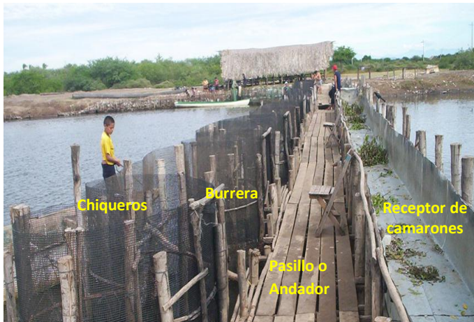
Figura N° 7. Tapo “El Colorado”, el más grande del estado de Nayarit.