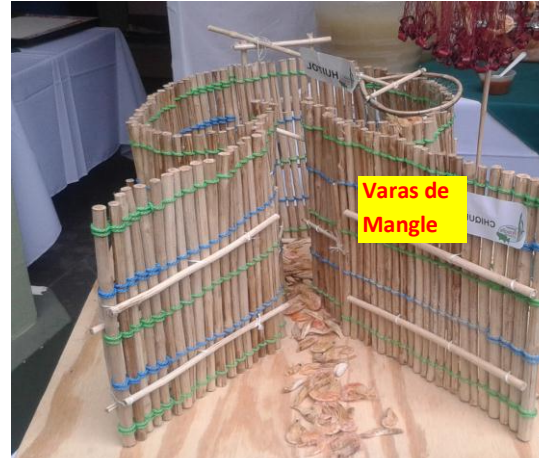
Figura N° 6 Chiquero del Tapo.