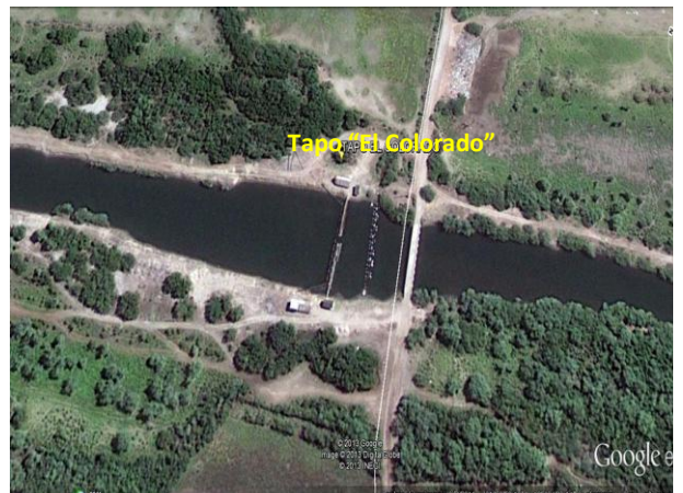
Figura N° 8. Tapo “El Colorado” vista Satelital Google earth.