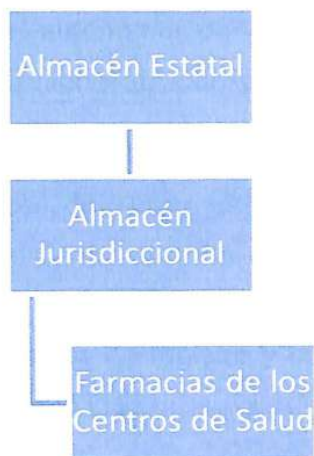
Diagrama 1. Ruta de distribución del suministro de medicamentos

La cadena de medicamentos es una herramienta para costear las operaciones realizadas a lo largo de la cadena del suministro de medicamentos; varias etapas se llevan a cabo en las farmacias tales como: suministro, almacenaje y dispensación las cuales son responsabilidad del farmacéutico.