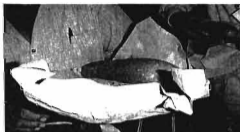
Fotografía N° 2 Variedad de calabaza para exportación