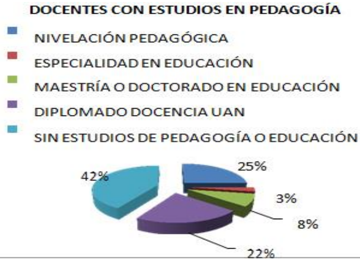
Tabla 2 Área Pedagógica

Del total de los docentes encuestados, los resultados fueron los siguientes: