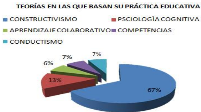
Tabla 3 Teorías de prácticas educativas

En lo concerniente en las teorías en las que basan su práctica docente cotidiana, se muestra la presente grafica con los siguientes resultados: