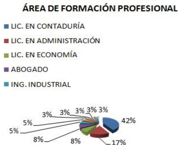
Tabla 1 Área Disciplinar

Los perfiles profesionales del total de los profesores a los cuales se les aplicó el instrumento, fueron los siguientes: